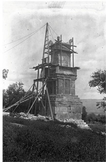
Brochure accompagnant l'exposition