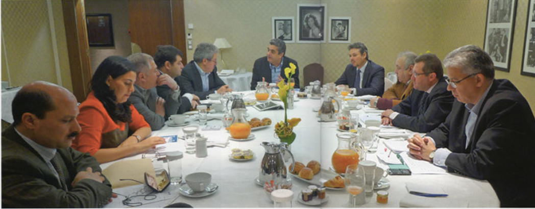
Table ronde Les TO tunisiens en France : leur diagnostic, leurs solutions

S'il n'y avait qu'un reproche à faire au tourisme tunisien, ce serait de n'avoir suscité que peu de vocations dans le tour-operating. Contrairement à nos concurrents comme la Turquie, dont les principaux TO dans de nombreux marchés sont d'origine turque, les TO tunisiens, malgré quelques succès, ne sont pas légion. Ceci explique peut-être que la Turquie reçoive aujourd'hui plus de trente millions de touristes et que nous n'en recevions que six. Le marché français est assez symptomatique de cette faiblesse tunisienne. En effet, il y a quelques décennies, l'atomisation du tour-operating français et notre proximité linguistique et culturelle avec ce pays pouvaient laisser prévoir l'émergence de TO tunisiens capables de s'accaparer une grande part du flux touristique vers la Tunisie et de le développer. Pourtant, après des succès réussis dans les années 80 et 90, où des TO tunisiens comme Republic Tours ou Couleurs Locales ont pu un temps rivaliser avec les grands, ces TO disparaissaient au moment même où montait le TO turc Etapes Nouvelles, devenu en l'espace de quelques années leader sur la Tunisie. Manque de vision, d'appui financier ou simplement de volonté, les acteurs du tourisme tunisien ont toujours préféré l'investissement dans le