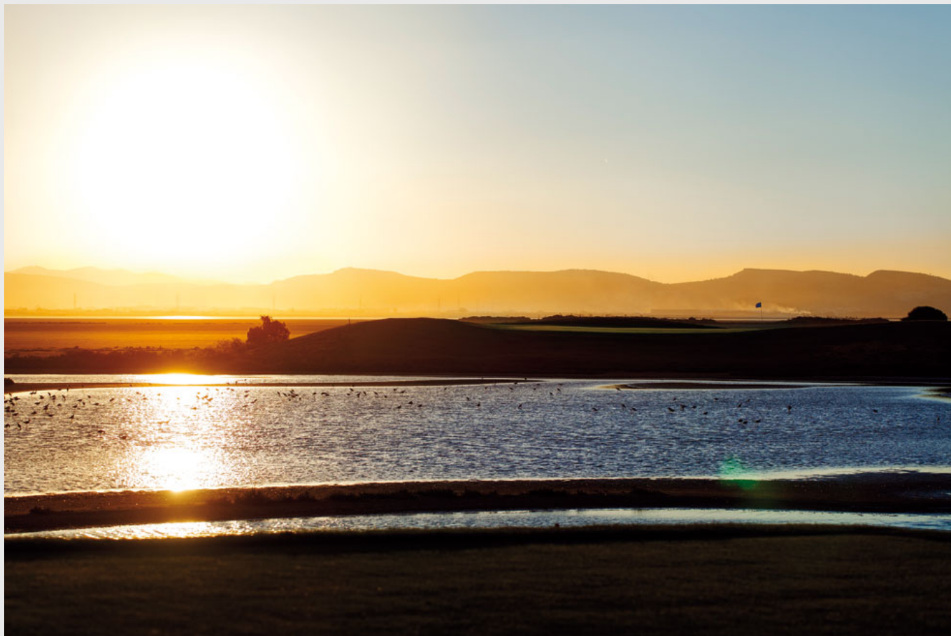
The Residence Golf Course.

Durant les dix dernières années, quand nous n'avons construit que deux parcours (Tozeur et Gammarth), on en construisait 15 en Turquie, et plus de 150 en Espagne, même s'il s'agissait parfois d'alibis pour des programmes immobiliers. Avec dix parcours éparpillés sur cinq régions, la Tunisie ne pouvait prétendre attirer ni les T0 spécialisés, ni les golfeurs, qui recherchent une destination régionale leur offrant une variété de terrains et lui restent volontiers fidèles.